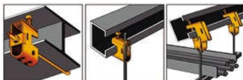
Cách lắp đặt KẸP XÀ GỒ PTT và PTT - T